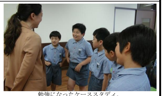
勉強になったケーススタディ。

の先生はみな、口を揃えて、「英会話に不安を覚えなくても大丈夫です。」と伝えてくれる。勿論、「英語を上手く話したい。」という向上心は大切である。五年生の子ども達は、英語の授業を見ている時も、平時より意欲的に取り組んでいることが分かる。しかし、英語を上手くしゃべれないことを恥ずかしながら、交流に消極的になってしまっている。それは、英語の上達や異文化交流に好影響は及ぼさない。グローバル