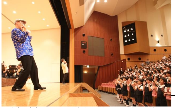
全身で音楽を表現する青島先生。会場中が元気いっぱい!

この日は、星野学園小学校の子ども達のステージ、小学生ステージも行われ、およそ三時間にも及ぶコンサートとなった。