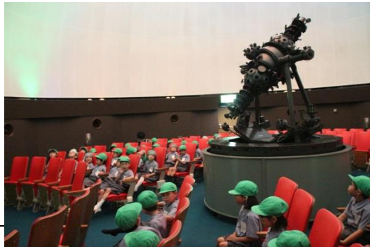
こどもの城にて。みんなで星空を鑑賞しました！

七月二日(土)、集会委員会の進行による七夕集會が行われた。本年度も星野ドームでの実施となった。日頃あまり交流をすることが少ない他学年との交流を深めるための企画だ。そのた