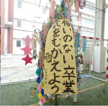
夏の学校、芸術鑑賞会、水泳、七夕……たくさんの行事がありましたね。