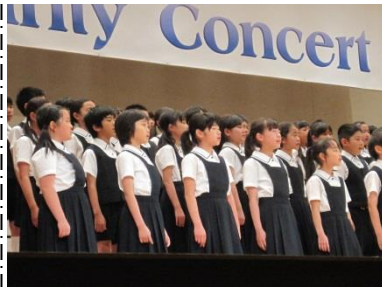
声を響かせる高学年。

温まる終幕となった。この日小学校にて承った募金額は二十七万三千五百円。日本赤十字社を通じて、熊本地震の被災者の方々への援助に役立てられることになる。多くの皆様のご賛同に、心から感謝申し上げます。