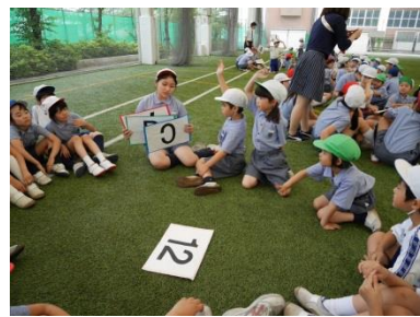
「どれにしようかな。」 作戦タイム中。

七月二日(土)、集会委員会の進行による七夕集會が行われた。本年度も星野ドームでの実施となった。日頃あまり交流をすることが少ない他学年との交流を深めるための企画だ。そのた