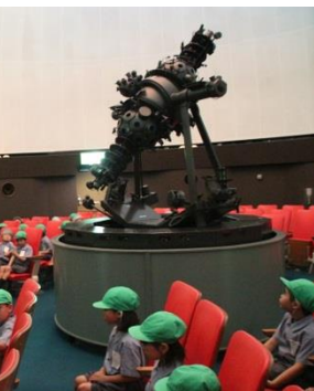
こどもの城にて。みんなで星空を鑑賞しました!

のべ二十二泊。本校における小学校六年間の宿泊行事での合計宿泊数である。七月六日(水)・七日(木)の両日、本校舎内にて、二十一日の最初の一泊目にあたる宿泊行事「夏の学校」が行われた。実際に親元を離れて生活をするこ