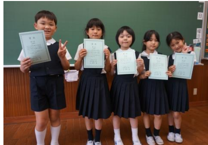
表彰状をもらってご満悦。

七月一日(金)から七月十二日(火)にかけて、一年生から四年生までの水泳大会が行われた。一学期の授業で練習した泳法だけでなく、宝探しやピート板等の道具を使った楽しい競技も行われ、クラス全体で意欲的に取り組めた。クラスで六チームに分かれ、競技ごとに